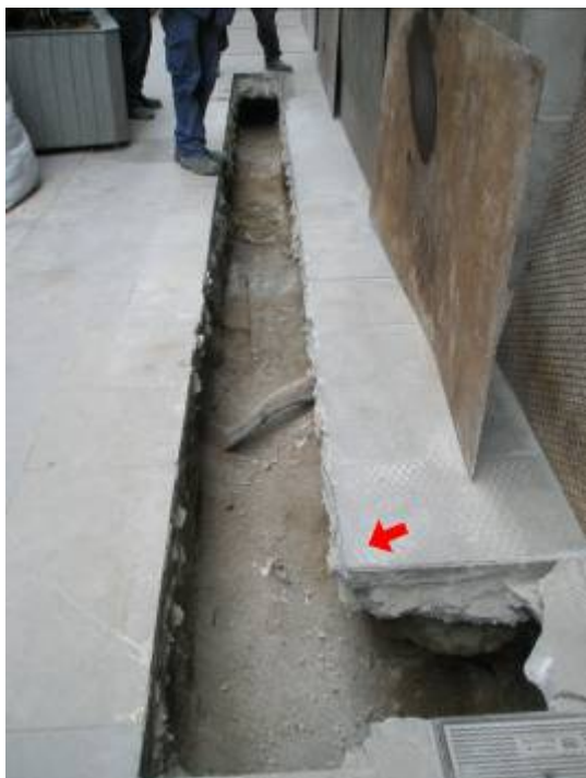
Cala 2 Rasa 100