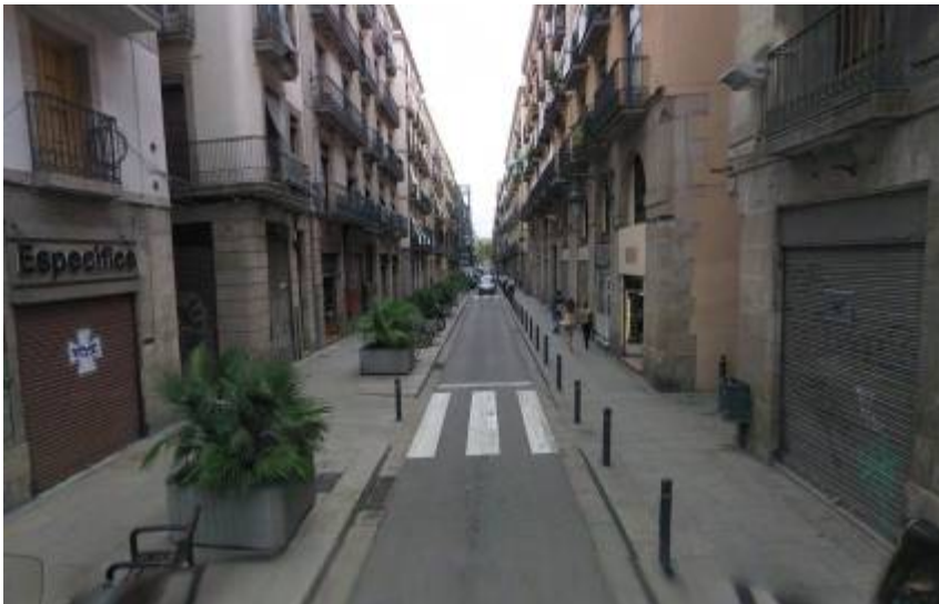
Tram del C/ Princesa on es va realitzar la intervenció