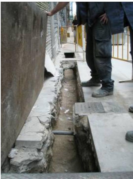
Cala 1 de la Rasa 100